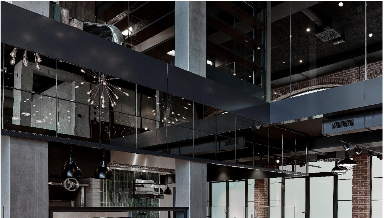
Rauchschürze mit Spiegelverglasung