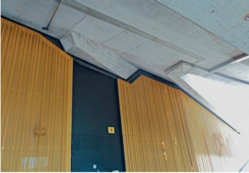
Anspruchsvolle Deckengeometrie. Der Anschluss erfolgte mit Sika-Membranfolien. Géométrie complexe du plafond. Le raccordement est effectué à l'aide de membranes Sika.