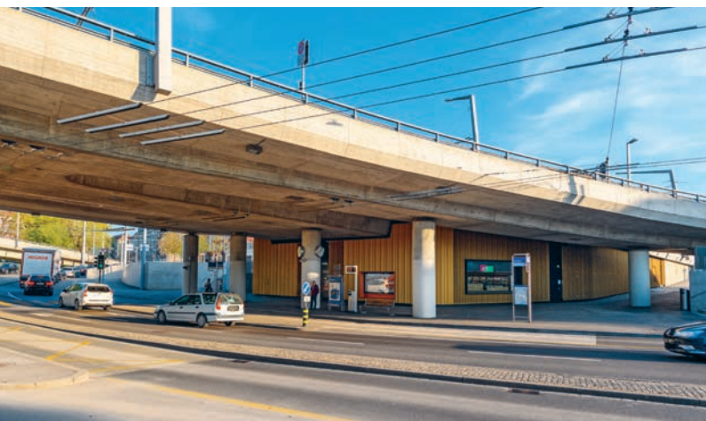
Stolze 85 m misst die abgewickelte Fassade. La façade déroulée mesure 85 m.