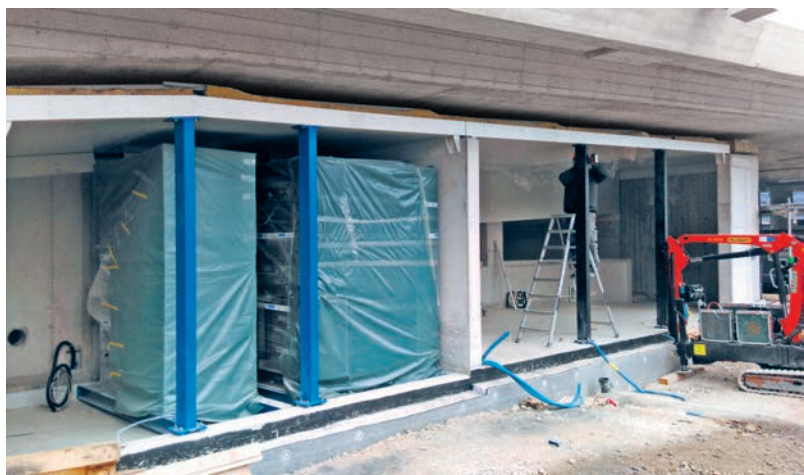
Anstrengende Montage der Deckenpaneele vom Typ Trimotherm SNVs-200 Power T. Ein einzelnes Element wiegt bei 8 m Länge rund 500 kg. Montage difficile des panneaux de plafond de type Trimotherm SNVs-200 Power T. Un seul élément pèse 500 kg pour une longueur de 8 m.